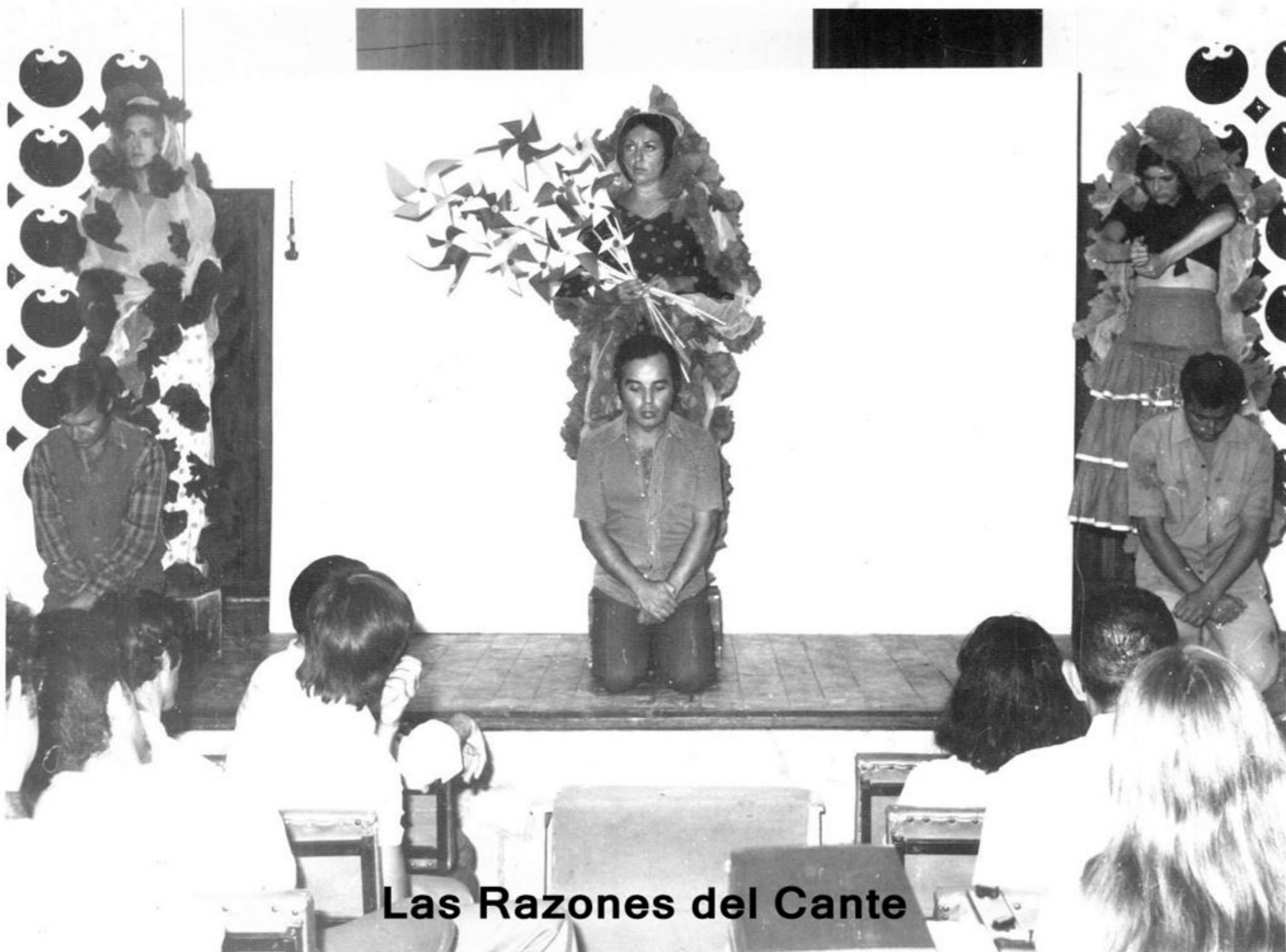
Las Razones del Cante